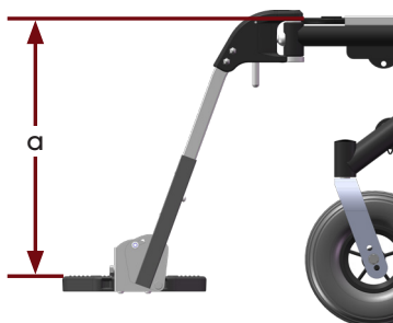
Tabell 2 - Funktionell längd, vinkelställbara benstöd [cm]. Mäts från sittbrickans ovansida till fotplattans trampyta.